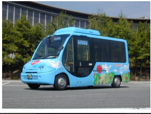
運行車両 (小型ノンステップバス)